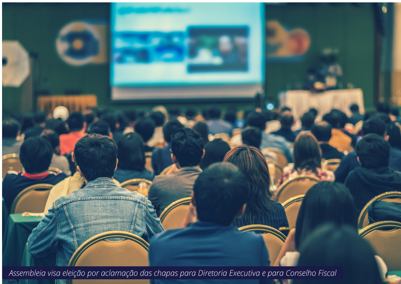
Assembleia visa eleição por aclamação das chapas para Diretoria Executiva e para Conselho Fiscal

ções que lhes conferem o artigo 53, § 1º, do Estatuto desta Entidade, e nos termos dos artigos 8º, inc. III, 9º, 37, inc. VI, da Constituição da República, convoca: