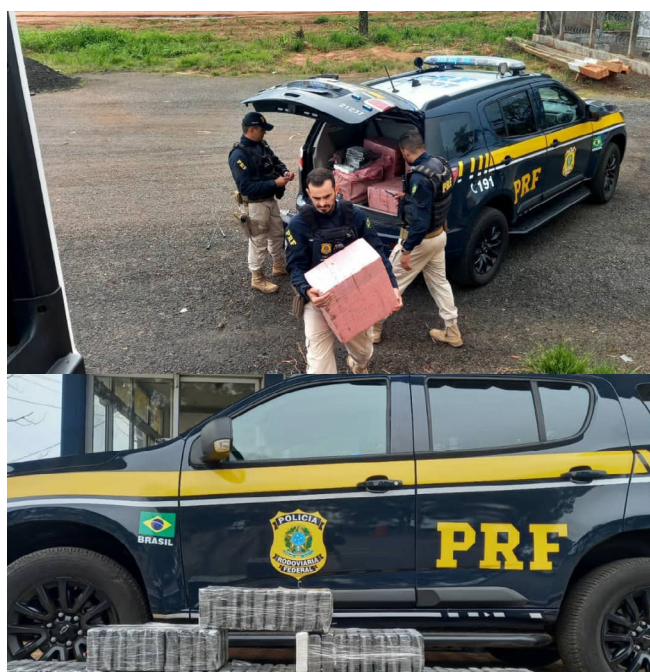
A droga estava sendo transportada dentro da cabine de um caminhão