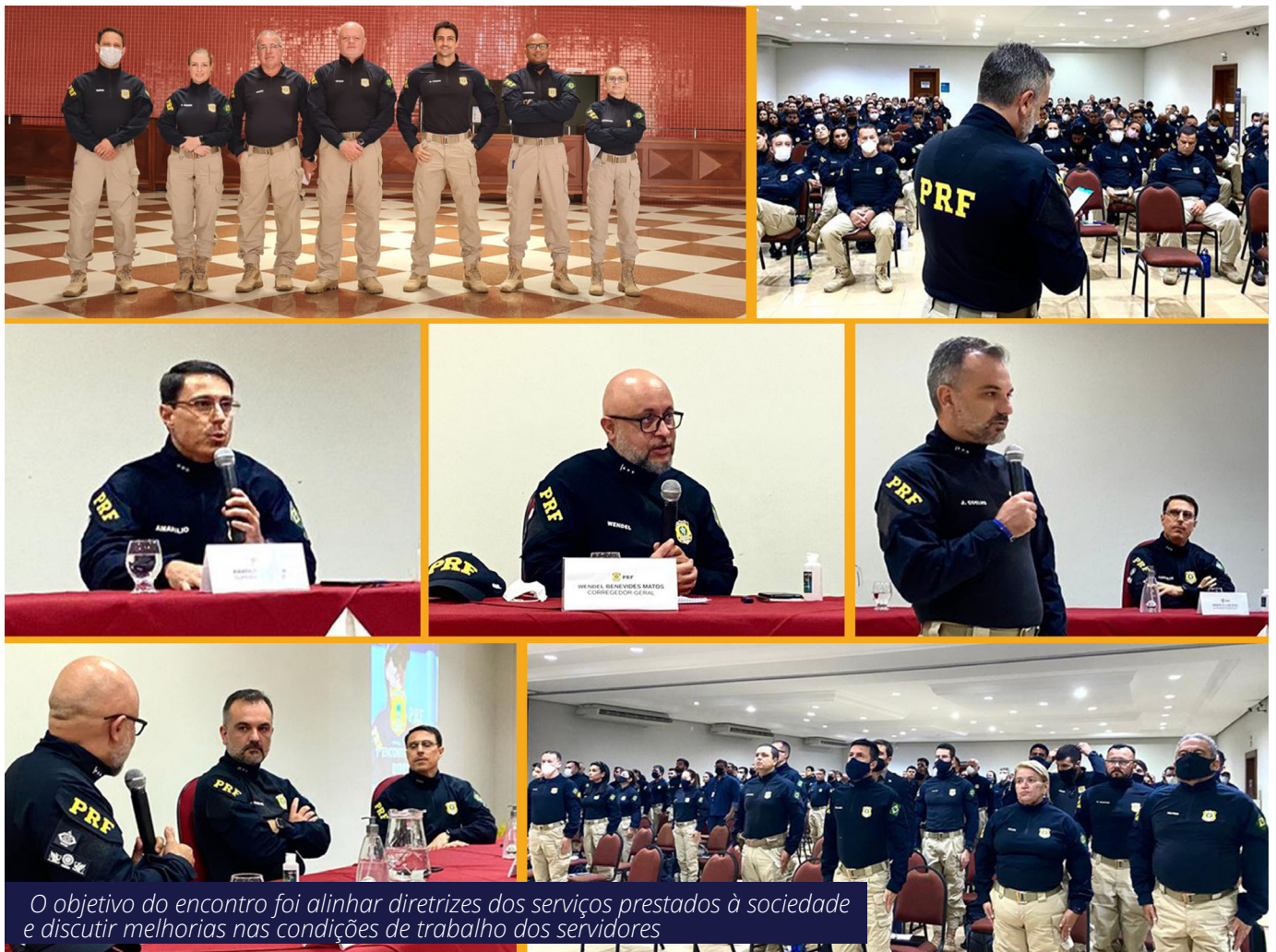
O objetivo do encontro foi alinhar diretrizes dos serviços prestados à sociedade e discutir melhorias nas condições de trabalho dos servidores

Na última segunda-feira, 30, a Polícia Rodoviária Federal (PRF) iniciou o 1º Encontro Nacional da Direção Executiva (DIREX), na cidade de Aracruz/ES.