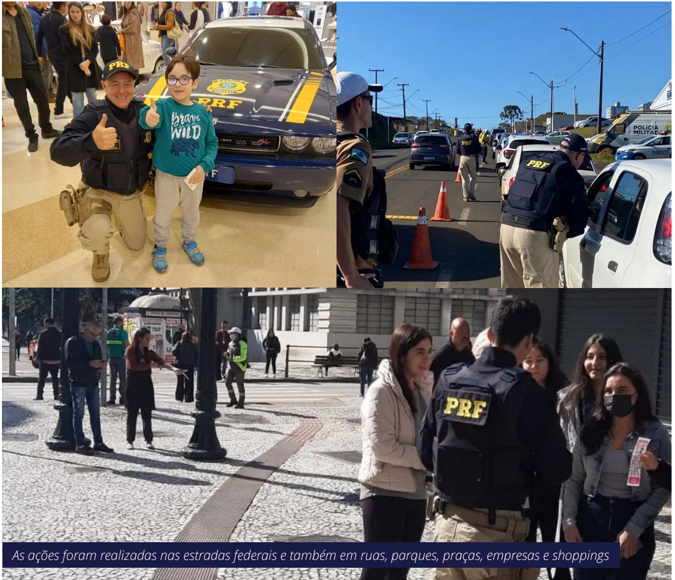
As ações foram realizadas nas estradas federais e também em ruas, parques, praças, empresas e shoppings

No mês de maio, quando é celebrada a campanha Maio Amarelo, a PRF-PR esteve intensamente envolvida em diversas ações por todo o estado do Paraná. O objetivo é buscar conscientizar e educar a sociedade sobre a importância das medidas de segurança no trânsito, com vistas à redução dos altos números de mortes e lesões.