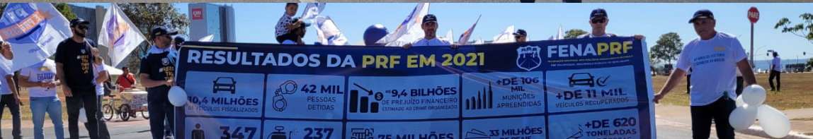
A manifestação, além de pressionar o líder da nação, demonstrou o quanto os PRFs estão unidos e interessados na causa.