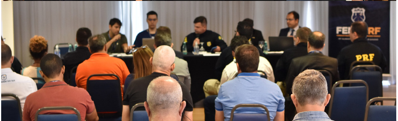
O diretor-geral se comprometeu a começar a entregar resposta a todas as demandas repassadas no prazo de 30 dias