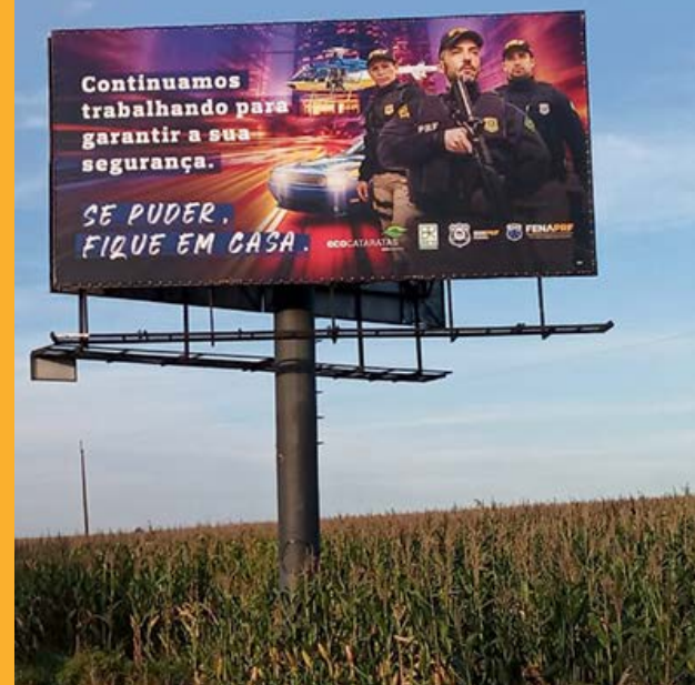
Outdoors na Região Oeste do Paraná

Essa campanha é de extrema importância para apresentar uma PRF de resultados efetivos para a população e ao Poder Público.