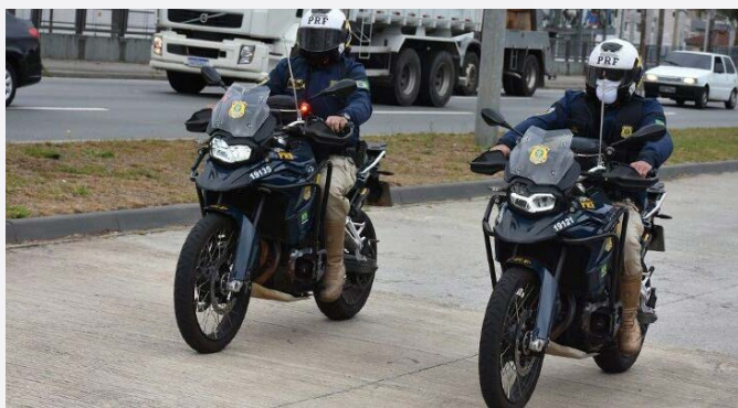
Medida restabelece a Instrução Normativa 99/2017 sobre regime de trabalho