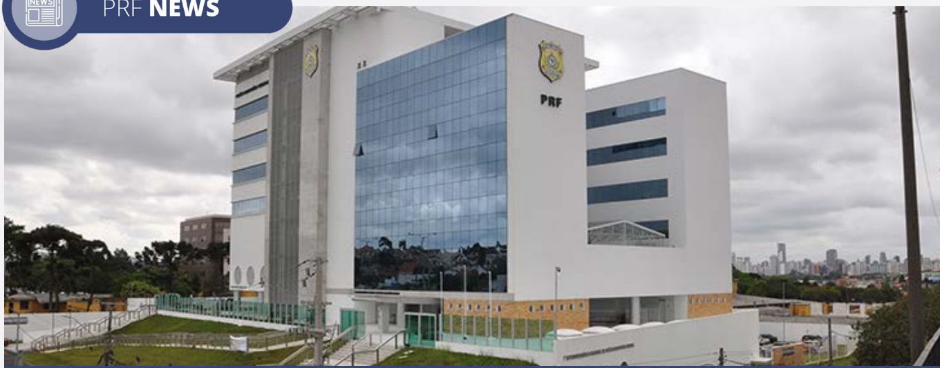
Sede da 7ª Superintendência da Polícia Rodoviária Federal em Curitiba