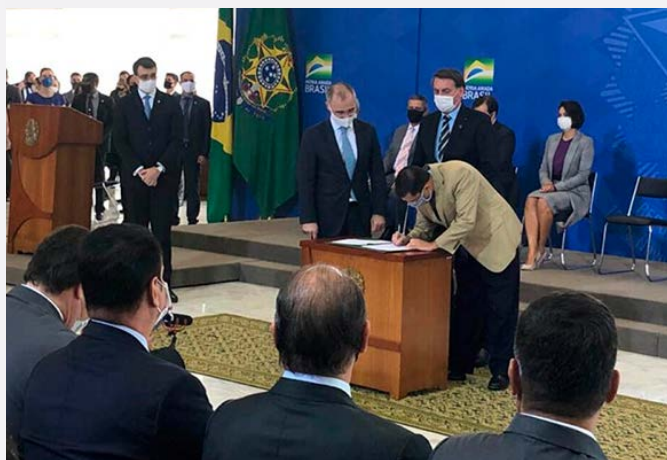
Presidente Jair Bolsonaro assina Parecer da Advocacia-Geral da União